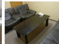
カンファレンス ルーム