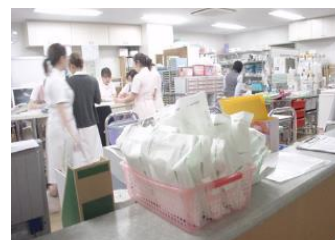
スタッフステーション